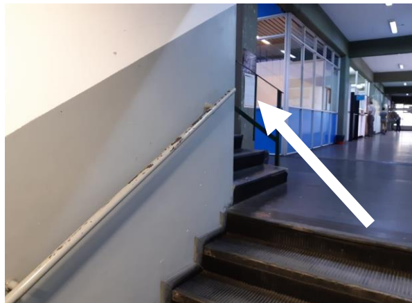
4. Tomando esta escalera hasta el último piso (tercero)