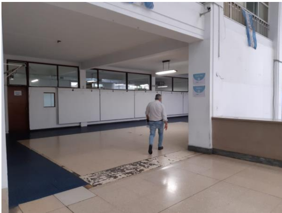
1. Desde el hall principal hacia el Ala La Rioja