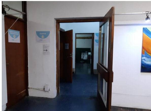
2. Pasando por hall en donde está ubicado el baño accesible